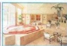
フィットネス・イオン (有料)