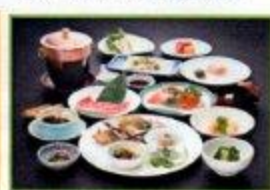
日本料理 (イメージ)