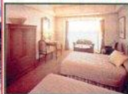
デラックス・ツイン