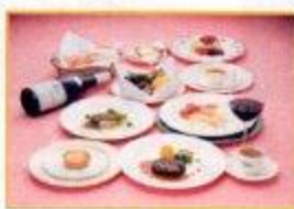
フランス料理 (イメージ)