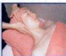
ブルミエールサロン (有料)