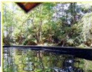
スパ・ユリーカの露天風呂